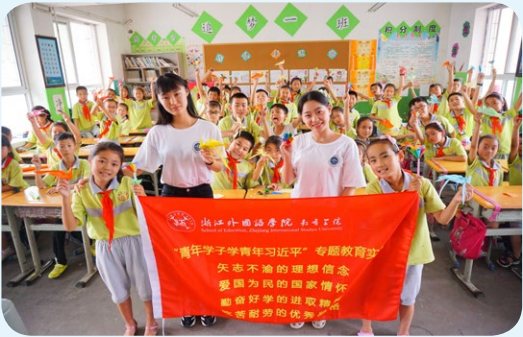
▲ 教育学院学子赴延川梁家河开展红色寻访和拓展课程支教之旅

就业方向： 近年毕业生就业率达 95% 以上，除部分毕业生在国内外知名高校深造外，绝大部分毕业生在杭州市学军小学、求是教育集团、文三教育集团、天长小学、卖鱼桥小学、滨江实验小学、崇文实验学校、娃哈哈双语学校、维翰国际学校、钱塘外语学校等省内外知名小学任教。