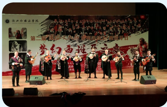
▲ 西语学院举办国际风情文化节

就业方向： 近年毕业生就业率达 95% 以上，其中 18.34% 升学读研，在西班牙巴塞罗那大学、西班牙康普顿斯大学、马德里卡洛斯三世大学、马德里欧洲大学以及北京外国语大学、上海外国语大学等高校深造；57.7% 的毕业生在华为、浙江宇视科技、横店集团、宁波凯越国贸集团、圣奥集团等大型企业就业。