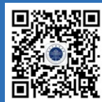
浙江外国语学院 招生办微信公众号

学校将视国家疫情防控情况，保留对相关考核内容、方式、时间地点等调整的权利。 浙江外国语学院享有本简章最终解释权。