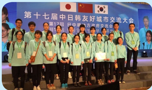
▲ 日语学子参加中日韩友好城市交流大会

就业方向： 日语专业毕业生就业率与就业质量保持双高。近年毕业生平均年就业率超过 95%，国际化就业率为 7.8%，主要涵盖传统外贸、日语教育、跨境电商、制造业等浙江企业走出去优势领域，为海康威视、松下等知名企业输送多名优秀毕业生。19.2% 的毕业生升学读研（其中海外升学率为 11.5%），在日本大阪大学、日本东北大学、日本京都大学、美国东北大学、北京大学、北京外国语大学、上海外国语大学、香港城市大学等知名高校深造。