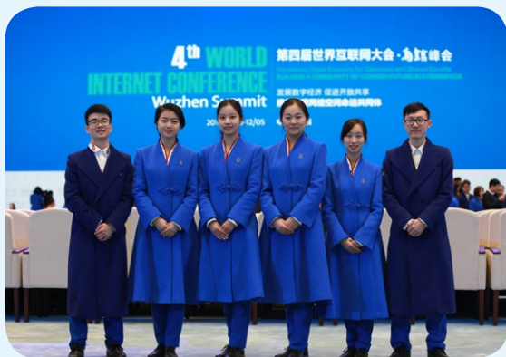
▲ 阿语学子服务乌镇世界互联网大会

制造业和传统外贸等浙江企业走出去优势领域，为执御、环球易购、Shein 等中东地区知名跨境电商企业以及得力集团、香港和记黄埔有限公司、雅乐科技等国际知名企业输送多名优秀毕业生。17.7% 的毕业生在澳大利亚墨尔本大学、荷兰莱顿大学、加拿大渥太华大学、瑞典隆德大学、埃及亚历山大大学、卡塔尔多哈研究生院以及北京外国语大学、上海外国语大学等知名学府深造。