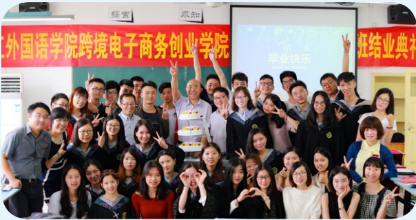
▲ 首届跨境电子商务 3+1 实验班结业典礼

销、跨境物流与供应链管理、国际贸易理论与实务、跨境电商 B2C 多平台运营、跨境电商 B2B 运营、独立站运营与管理、跨境电商视觉营销与美工、报关与报检等。聘请了 20 多名企业导师进校共同授课。大四时可选择进入 3+1 跨境电商实验班。