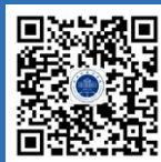
浙江外国语学院 微信公众号