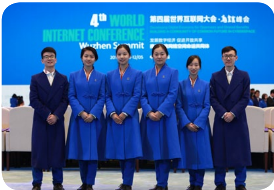
▲ 东语学子服务乌镇互联网大会

培养目标：本专业旨在培养具备扎实阿拉伯语语言功底和良好的英语交际能力，同时掌握一门非外语类专业基础知识，熟悉阿拉伯伊斯兰文化、了解阿拉伯地区国情，具有国际化视野和良好跨文化交际能力的应用型人才。 主要课程：阿拉伯语精读、阿拉伯语视听说、阿拉伯语语法、阿拉伯语阅读、阿拉伯国家社会与文化、阿拉伯语翻译理论与实践、阿拉伯语口译等；本专业大三学生原则上需赴国外院校进行至少一个学期的海外学习，国际合作院校包括埃及苏伊士运河大学、摩洛哥哈桑二世大学、阿曼苏坦尔大学等。 就业方向：历届毕业生就业率在 97% 以上。2019 届毕业生中有 18.6% 考上国内外知名高校研究生，在国外高校继续深造的有埃及亚历山大大学、多哈研究生院等，考上国内研究生的有北京外国语大学、北京第二外国语学院等。1 人被国家汉办录用为摩洛哥阿卜杜·马立克·阿萨德大学孔子学院志愿者教师，8 人进入迪拜 SUNTOUR INT'L FZCO 公司、浙江执御信息技术有限公司、浙江横店进出口有限公司、得力集团有限公司、中国南方航空股份有限公司等外资企业、大中型跨境电商进出口企业、大中型企业国际事业部门工作。