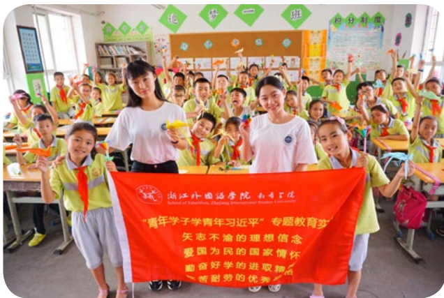
▲ 教育学院学子赴延川梁家河开展红色寻访和拓展课程支教之旅

就业方向： 根据2019届毕业生就业情况，就业率达到98.88%，除部分同学在国内知名高校升学读研外，绝大部分毕业生在杭州市学军小学、求是教育集团、文三教育集团、天长小学、行知小学、维翰国际学校、钱塘外语学校等省内外知名小学任教。