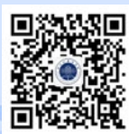
浙江外国语学院 招生办微信公众号