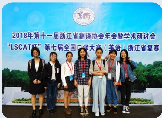
▲ 英文学子参加全国口译大赛浙江省复赛

主要课程： 口译基础、英汉互译技巧、口译听辨与译述、公共演讲与辩论、联络口译、英汉交替传译、旅游口译、商务口译、文化教育口译、外事口译、英汉语言比较与翻译、实用文体翻译、计算机辅助翻译、编译与摘译、翻译赏析。