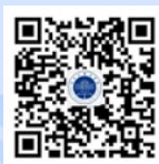
浙江外国语学院 微信公众号