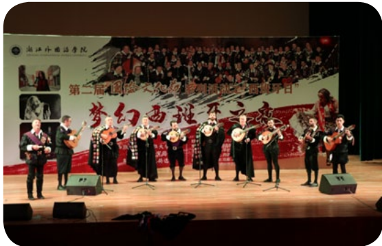
▲ 西语学院举办国际风情文化节

就业方向： 根据 2019 届毕业生就业情况，毕业生就业率 98.5%，其中 13.2% 的毕业生升学读研，在北京外国语大学、西班牙萨拉戈萨大学、西班牙巴塞罗那大学、西班牙康普顿斯大学、马德里欧洲大学皇马学院、马德里卡洛斯三世大学等国内外高校深造，69.1% 的毕业生在华为、浙江宇视、宁波凯越国贸集团等大型企