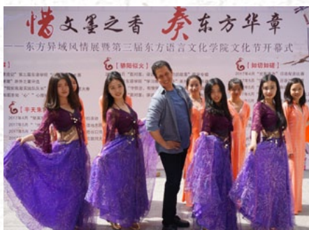
▲ 东语师生在东方异域风情展进行表演

就业方向： 根据 2018 届毕业生就业情况，毕业生就业率 100%，其中 21.7% 的毕业生升入北京外国语大学、上海外国语大学等知名高校攻读硕士研究生，69.6% 的毕业生在国内最大中东电商平台浙江执御信息技术有限公司、兰亭集势贸易（深圳）有限公司等与中东有经贸业务的大型企业就业，1 人自主创业，1 人考取国内公务员。