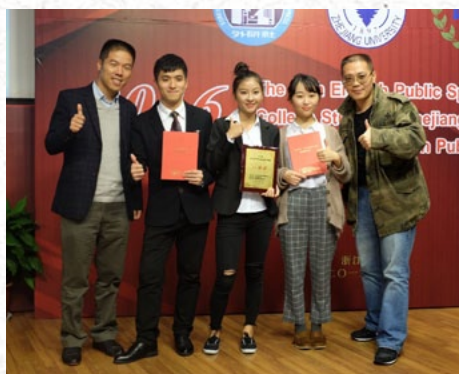
▲ 英文学院学子在省大学生英语演讲竞赛中获一等奖

培养目标： 本专业以培养学生口译实践能力为核心，注重对英汉双语口头表达能力和跨文化交际能力的培养，开发学生的沟通协调、团队合作、灵活应变、善于学习、抗压能力等译员所需的综合能力，毕业生具备扎实的中英双语语言基础、良好的职业道德修养与人文素养、宽广的国际视野与跨文化交流能力，掌握口、笔译基本技能，能够胜任经贸、教育、文化、科技、外交等领域中一般难度的口笔译、跨文化交流、语言服务等方面的工作，又有能力进入政府机关、企事业单位的不同部门从事语言服务的相关工作。